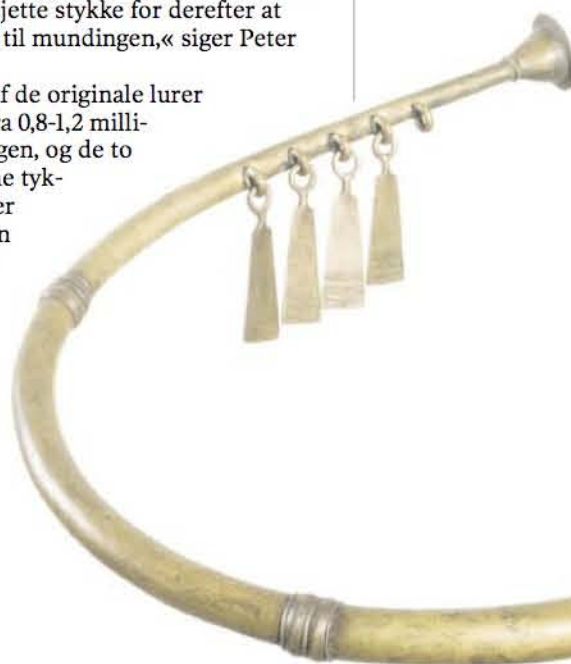
En original lur af bronze fra Brudevælte Mose.

Alle lurer svinger i 440 hertz, det samme som den moderne kammerton A.